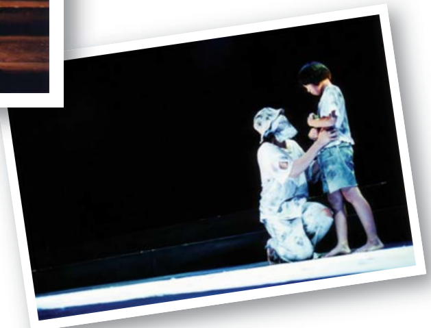
“いつまでも昔のことに涙をしたら ダメ、前向きに生きなくちゃ”、と 励ましてくれる謎の中国人。