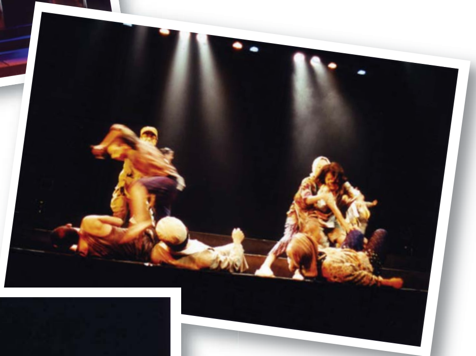
食糧難で、大人と孤児たちが 乱闘を繰り返した。