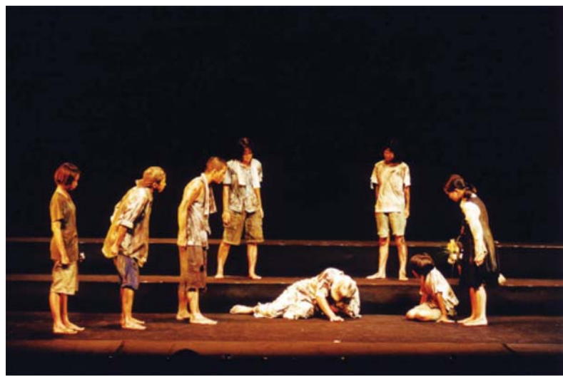
謎の中国人との出会い。大人も子供 も戦争の犠牲者であることを初めて 知らせられた孤児たち。